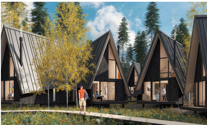
Домики приспособлены для комфортного проживания